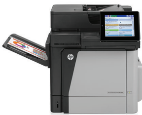
Impresora multifuncional HP Color LaserJet Enterprise M680dn

Afronte trabajos de gran volumen con esta impresora multifunc. color alto rendimiento. Impresión y copia, escaneo y fax 1 . Car. de escaneo mejoradas y pantalla táctil en color de 20 cm (8 pulgadas) con flujo de trabajo optimizado. Opciones de impr. móvil para mantener la produc. en sus viajes 2 .